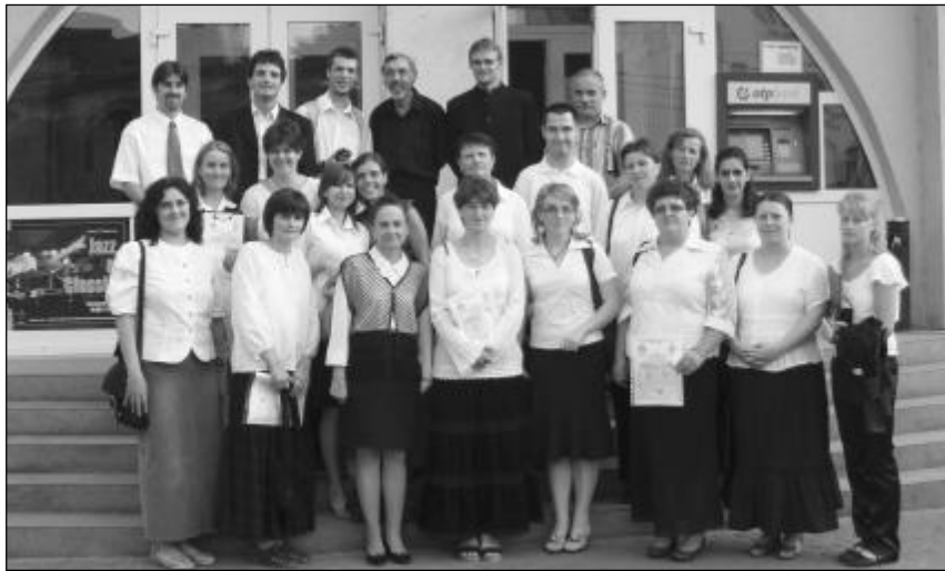
A 2008-as Kántorképző Tanfolyam hallgatói és tanárai az Arany János Kollégium előtt. A tartalmak két hét az oklevelek kiosztásával zárult

Harmadik alkalommal zajlott Kántorképző Tanfolyam a Királyhágómelléki Református Egyházkerület szervezésében, szeptember 1-12. között Nagyváradon. Idén 17 hallgató vett részt, négy csoportban, kinek-kinek felkészültségi szintjéhez mérten.