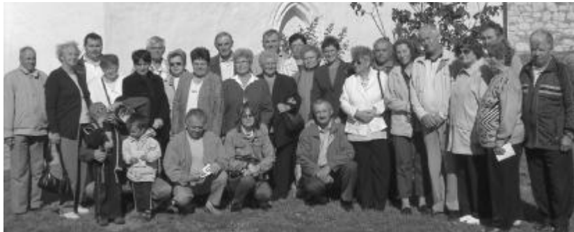
A bibliafordító nyomában. A zilahi utazók Vizsolyt is felkeresték

Nem hagyhattuk ki Boldogkővár megtekintését sem. Egy-egy ilyen magaslatról széttekintve érzi, látja a parányi ember, mily csodálatos minden, amit Isten az ember „kezebe” adott. Istent dicsőítő gondolataink ezentúl csak megsokszorozódtak, hisz ily rövid idő alatt, oly sok gyönyörűséget látva csakis hála és köszönet szállhat fel Hozzá, ki teremtője és megtartója mindennek, amit a nemzedékek örökségbe kaptak.