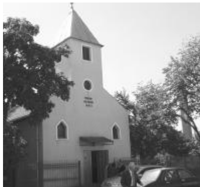
A borosjenői református templom

Többször hívták egyetemi oktatónak, de ő Trianon után is itt maradt, vállalta a kisebb-