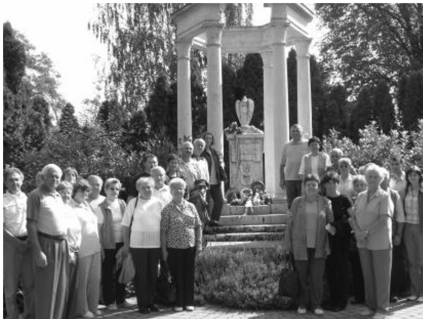
Tisztelgés a Himnusz írója előtt. A szatmárcsekei Kőlcsey emlékhelynél

A temető csónak alakú fejfáit csodálhattuk meg Szatmárcsékén. A temetői út, Himnuszunk írójának, Kőlcsey Ferenc sírjánál szélesedett ki. A kis magaslaton álló sírmeleg jól szimbolizálja Kőlcsey kiemelkedő egyéniségét is. Jólesett ilyen felemelő „alkotóközben” élelni szép, meghatározó Himnuszunkat.