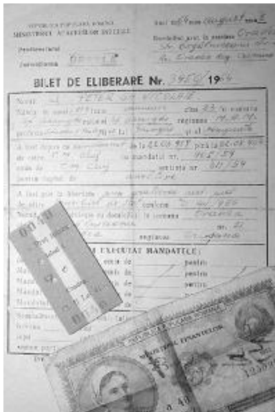
Az 1964. augusztus 2-án kiállított szabadulólévlé

– Van még a rádiózásnál is régebbi „foglalkozásom”: a színművészet. Hatodik osztályos koromban léptem fel először igazi