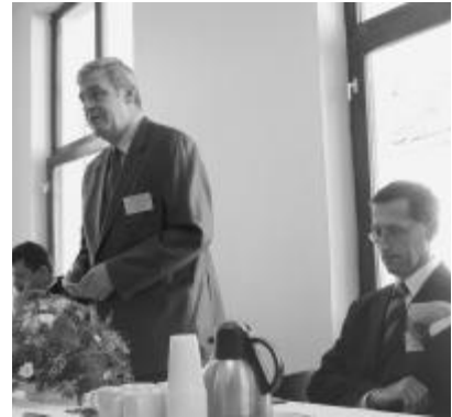
A püspök példák sorát említette az egyház politikai szerepvállalása mellett

Mintegy igazolandó, hogy cseppet sem újkeletű kérdés az egyház politikai-közéleti szerepvállalása és véleménynyilvánítása, a püspök egy szekus főtiszt és Papp László, a rendszerváltás előtti utolsó váradai egyházfőhöz intézett „intelmeit” is felidézte. Előbbi