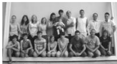
A várad-újvárosi evangelizáció néhány résztvevője