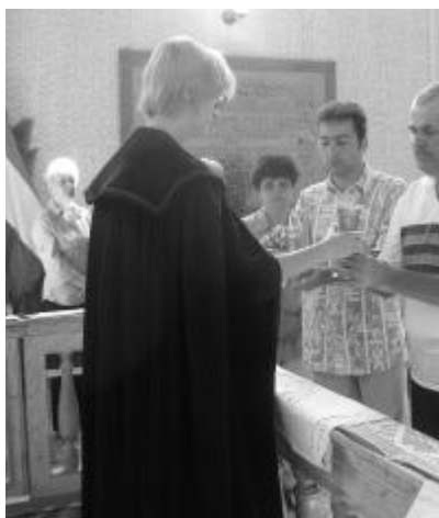
Újkenyeri úrvacsoraszervezés Végváron, a kibúcsúzó istentiszteleten

* A vers a szamosújvári börtön „papi szobájában” született 1960-ban.