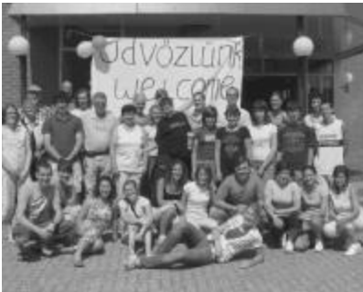
A belényesújlaki fiatalok, holland vendéglátóik társaságában

HÁLAADÓ ISTENTISZTELETET TARTOTTAK BATIZON. A Szatmári egyházmegyéhez tartozó gyülekezet szeptember 14-én mondott hálát a felújított parókiáért és az újonnan épített gyülekezeti teremért. Tőkés László püspök igehirdetésében a szétszéledés megakadályozásáról beszélt, kiemelve: a mai társadalomban nemcsak a világban szóródik szét a magyarság, hanem saját közösségükben sem találják egymásra az embereket. Ennek ellenpéldája az, ami Batizon történt – hangsúlyozta a püspök. A helyiek nevében Király Lajos lelkipásztor üdvözölte a megjelenteket, majd a környékbeli településekről érkezett, több mint 20 lelkipásztor mondott igei köszöntőt. Az ünnepség a helyi gyerekek szavalata és a Dinu Lipatti Filharmónia kamarazenekara fellépése után szeretetvendégséggel zárult.