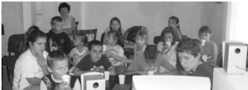
Az apátkeresztúri gyerekek Pál apostol nyomába eredtek, a bibliahéten szerzett élményeiket pedig saját kis újságban foglalták össze

Minden délután, az uzsonna után a kisebbek rajzfilmet néztek. A második napon