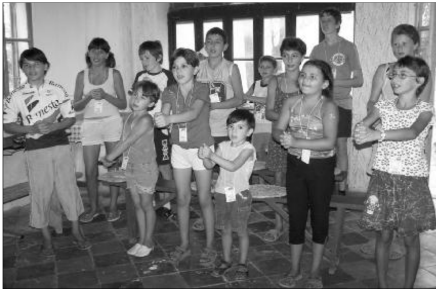
Anton tizennégy pár lábacska követte végig Pál apostol életének főbb állomásait. A gyülekezetben első alkalommal szervezték meg a vakációs bibliahetet

„Engedjétek hozzám jönni a kisgyermeket, és ne tiltsátok el őket, mert ilyeneké az Istennek országa.” (Lk 18,16). Első alkalommal szerveztünk Vakációs Bibliahetet az Ant-i Református Egyházközségben (Bihari Egyházmegye) augusztus 20-24. között.