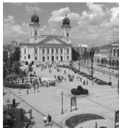
A debreceni Nagytemplom az anyaországi reformátusság egyik szimbóluma