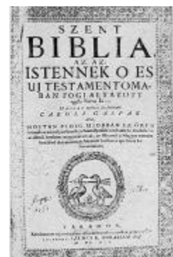
„Szent Biblia, azaz: Istennek o és új testamentumában foglaltott egész Szent Írás.” A Váradi Biblia címlapja