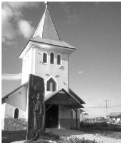
Jankafalva szemet gyönyörködtető református temploma, az előtérben a Bocskai-emlékművel

Az Érmelléki Egyházmegyéhez tartozó gyülekezet régi vágya, hogy a világháborúk helybéli áldozatai is emléket kapjanak, ahol a mai utódok emlékezhetnek rájuk. Az emlékmű, terveink szerint, egy terméskő-talapzaton álló kis obeliszk lenne. Az obeliszk tejetén Turul-madár terjeszti ki szárnyait, az