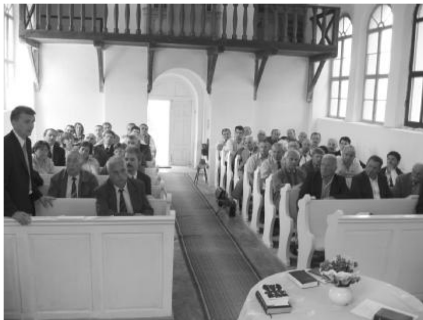
Hogyan tartjuk meg, a már megkonfirmált ifjainkat? A találkozón több fontos kérdés felvetődött