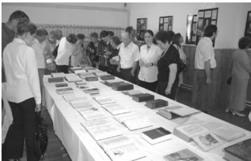
Szilágycsehi bibliakiállítás. Mintegy 19, száz évnél régebbi Bibliát is kiállítottak, melyek a gyülekezeti tagok tulajdonát képezik