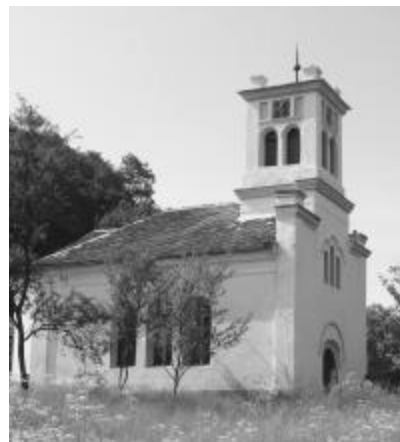
A hidalmási templom