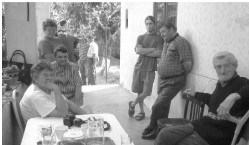
Kitartnak egyházuk mellett. Az igéből merítik az erőt...

HÁTTÉR: Az egykori gencsi lelkész, Bátori Gyulát nagy összegű sikkasztás miatt palástvesztéssel sújtotta a Királyhágómelléki Református Egyházkerület, illetve a Zsinat feyhelmi bizottsága. A nagykárolyi rendőrség ugyanezen vétség miatt bűnvádi eljárást folytat ellene. E súlyos körülmények ellenére Bátori számtalan pert zúdított az egyházközségre, az egyházmegyére és az egyházkerületre. Az egyházi autonómiát semmibe vevő döntéshozók azt az ítéletet hozták, hogy az egyházkerület szabálytalanul járt el, amikor a bűncselekményt kimerítő tények ellenére elbocsátotta a papot állásából – áll az egyházkerület június 20-án kelt tiltakozó nyilatkozatában, melyet Tökés László püspök-képviselő és Csúry István helyettes püspök látott el kézjegyével. Bátorit ezt követően végrehajtóval, illetve kommandósok, rendőrök és csendőrök seregével többször is megpróbált jogtalanul visszaköltözni a gencsi parókiára, ám ezt a helybéli református hívek mindannyiszor megakadályozták. Az egyházkerület vezetői tiltakozásukban nyomatékosan visszautasítják, hogy az egyház és a vallásszabadság sérelmére újból karhatalmi erőszakkal, maszkos antiterrorista egységek indokolatlan bevetésével fenyegetessék és félemlítsék meg a békés református híveket és a falu közösségét.