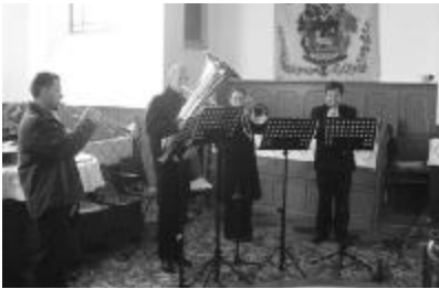
A Jerikó együttes, egyik fellépésük alkalmával