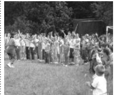
Vidám gyermekszívjav töltötte meg a hidalmási egyházi központot