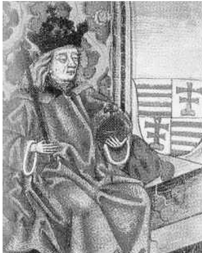
IV. Béla uralkodói díszben, korabeli ábrázolás