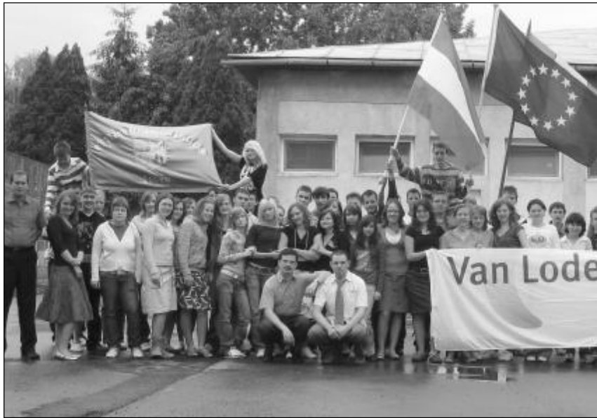
Jövőre a zilahi református kollégium diákjai látogatnak a holland testvériskolába. Képünkön a zilahi és a lodensteini diákok, tanáraikkal

Csodálatos napot tölthettem május 30-án Zilahon, a Református Wesselényi Kollégiumban. Érettségi vizsga volt bibliaismeretből. A diákok izalmát a tűző nap is tetézte. Ám hamar rájöttem, hogy ők, akik Isten nagyságos dolgaiban mélyedtek el, nem csalatkozhatnak: aki az Úrban bízik, nem csalatkozik.