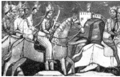
IV. Béla menekül az öt üldöző tatárak elől

1240 végére félelmes katonai erővel rendelkező mongol seregek érték el az ország keleti határait. A király már korábban is tudott a tatárok készülődéséről, mivel Julianus