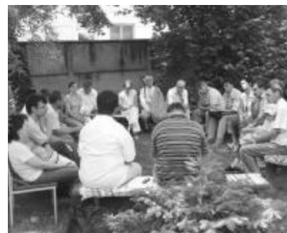
Az újszentesi parókia kertjében tartották a Temesvári Egyházmegye lelkeszerkezetét