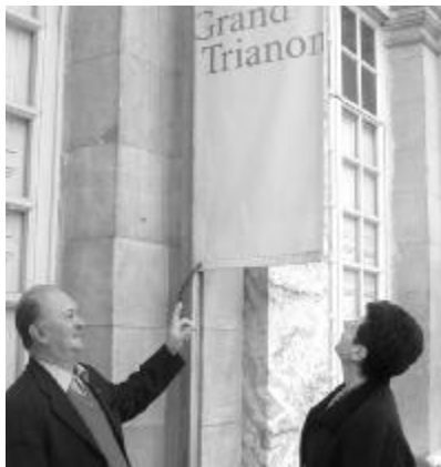
A szerző és felesége, a Trianon palota bejáratánál

Történik pedig, hogy felemelkednek Európa sorompói, emberhez méltó szabad egyszerűséggel Párizsba repülünk, s vendéglátónk a közeli Ver-