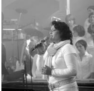
A hollandiai Schirchadasj&band együttes koncertje az ifjúsági találkozó fénypontját jelentette, a Várad-Olaszi református templomban

Bár a népességi indexeink elszomorítóak, mégis tennünk kell valamit. Mindenek előtt nem szabad elfelednünk, hogy Isten gondoskodik a maga anyaszentegyházáról. Ez a reménység vezet valamennyiünket tovább, másképp értelmetlen lenne a munkánk. A missziói munkának egy szelete az ifjúsági munka, de talán ez a legnehezebb. Ezt azzal támasztanám alá, hogy addig amíg a Nőszövetségek tagjai felelősen gondolkodó felnőttek, akik jövedelemmel is rendelkeznek, addig ifjaink korban, gondolkodásban is hátrányosabb helyzetben vannak, és jövedelem nélküliek, így aztán végképp nehezkesse válik a munka, mert azt várják, hogy minden készen eléjük legyen téve, és mint jó fogyasztók, ők majd részeseznek belőle. Nem is lenne rossz, ha állandóan így lenne, igen ám, de a gondok ott kezdődnek, amikor a stafétát át kell adni és venni, és az ifjak felnőttekké válnak, de ők már nem akarnak programokat szervezni vagy áldozatot hozni az éppen aktuális ifjúságért. Mintha ráismernénk napjaink csak fogyasztó, de kevésbé termelő társadalmára. Meg kell tanulnunk, hogy elérkezik majd az idő, amikor az ifjaknak is alkotniuk kell, és itt mérhető le, hogy ki mennyire tettrekész, mert ez lenne a tét. Erdélyben minden magyar felelős minden magyarért,