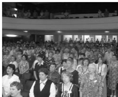
Közel 800-an vettek részt a Partium minden szegletéből a tizedik egyházkerületi nőszövetségi konferencián

A nagyszántói nőszövetség új zászlajának megáldását a záró istentisztelet követte, amelynek igehirdetési szolgálatát Balázsné Kiss Csilla egyházkerületi nőszövetségi