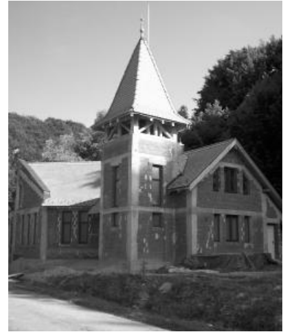
A feketeerdői templom egy nyár eleji felvételen

Az utolsó érv, amit még említenem kell, a megbocsátás. Mert ki más tudná úgy megbocsátani minden bűnömöt, mint Ő.