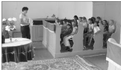
A 42 lélekszámú Érszodorói Egyházközségben 18 gyermek vett részt a foglalkozásokon