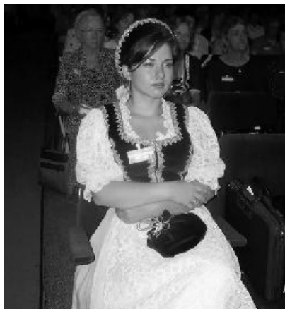
A Szatmár-szamosmegyei gyülekezet egyik ifjú képviselője népviseletben

A 458-as ének elnéklése után D. Tőkés László püspök, meghívott igehirdető köszöntötte a konferencia tagjait, örömmel nyugtázva, hogy egyházkerültünkben a nők megtalálják a szolgálatot, jó hogy ilyen