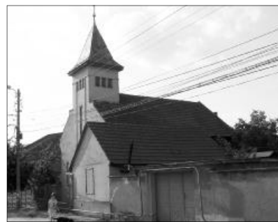
A boksánbányai református templom. Építése 1937-ben kezdődött és 1938-ban be is fejeződött