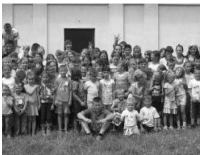
Júliusban tizedik alkalommal rendeztük meg a nyári vakációs bibliahetet az érsemjéni gyermekeknek

Július 6 és 12. között immár tizedik alkalommal rendeztük meg a hagyományos nyári vakációs bibliahetet gyermekeink számára. Akárcsak az elmúlt esztendőkből, idén is szép számmal gyűltek össze gyermekeink gyülekeze-ti házuk nagytermében, sok szépet és hasznosat tanulva a bibliahét alatt, hitben épülve a község más felekezeteihez tartozó gyermekeivel együtt.