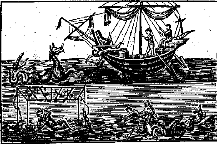
Jónás egy második századi római katakombafestmény alapján készült fametszeten

Olvasandó: Jón 2,1-11. Mindannyiunk számára ismerős a Jónás története. De miről is van szó? Mit is akar Jónás által Isten mondani nekünk? A legteljesebben ez a rész fejezi ki Isten szeretetét az engedetlen Jónás és a mai engedetlen emberek felé is.