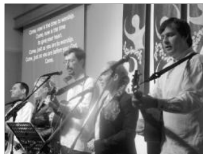
Fellépés a skóciai Falkirkban, az Olivet Evangéliumi Gyülekezetben