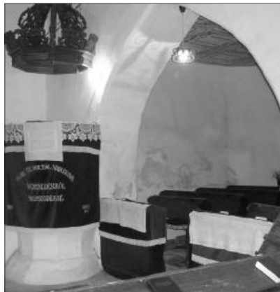
Uram, te voltál hajlékunk nemzedékről nemzedékre. Menyői templombelső

A templom mellett impozáns, 25 méter magasságú, sátorfedésű harangláb áll, mely