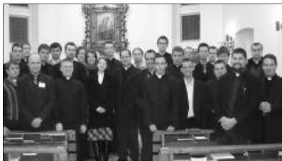
A Corpus Christi legutóbbi konferenciáján az ökumenikus párbeszéd válságos pontjairól értekeztek

A Corpus Christi Ökumenikus Ifjúsági Szervezet az egész Erdélyre kiterjedő közösség, melynek célja, hogy egy asztalhoz ültessen olyan teológiát és más szekuláris tudományokat hallgató egyetemistákat, akik érdekeltek a különböző teológiai és egyházi kérdések megvitatásában, oly módon, hogy egyszerűen és készen megismerni azokat az álláspontokat is, amelyeket a különböző történelmi felekezetek hagyományai és tanításai képviselnek. Ezért ökumenikus a szervezet, illetve azért is, mert hisszük, hogy Krisztus Teste, az Egyház egy, és ezért az egységért imádkozni és tenni szeretnénk, mert sokszor úgy tűnik, hogy ez az egység a történelem során a konfliktusok martalékává lett. Minden szomorú meghasonlás ellenére egyetlen Egyház létezik, s ennek a mennyei közösségnek tagjaiként ülnek le egymás mellé azok a fiatalok, akik időről időre részt vesznek a Corpus Christi rendezvényein.