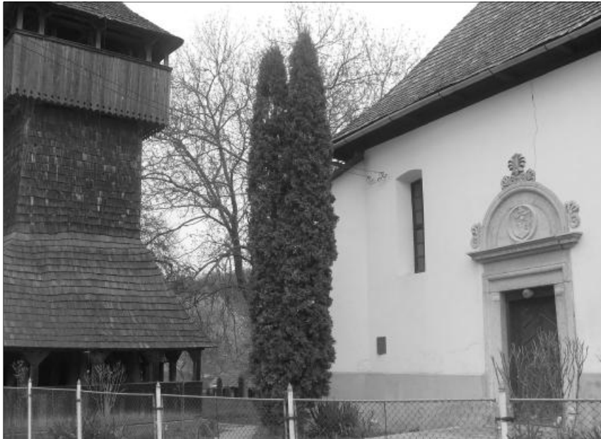
A menyői templom és harangláb. A 175 lélekből álló gyülekezet legfőbb gondja az elöregedés