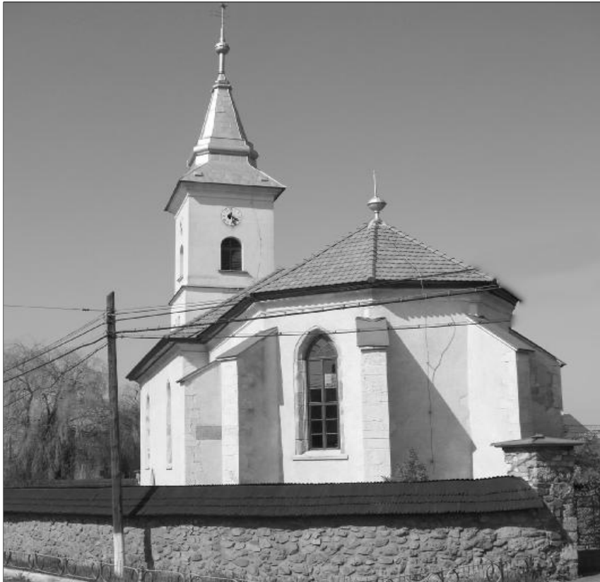
Híres szülőföldre emlékezett templomában a misztótfalusi eklézsia

Ez év elején személyes beszélgetésekben többször hangzottunk, hogy jó lenne megemlékezni Misztótfalusi Kis Miklós születésének 360. és házasságkötésének 320. évfordulójáról, ráadásul idén lelkészértekezlet szervezésével is soron következünk, a misztótfalusi gyülekezettel. Gondolatainkat szeptember 28-án ültettük gyakorlatba, a Comunitas Alapítvány támogatásával.