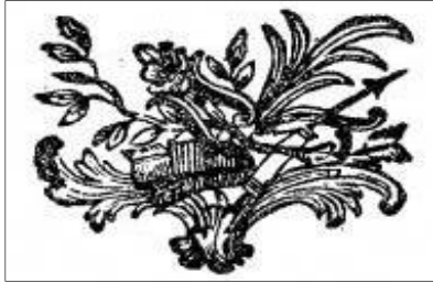
Kós Károly alkotása

Az Úr Jézus földi életének utolsó óráiban hangzik el ez a figyelmeztetés, mert előre látja, hogy Egyházába is beszívároghat majd ez a fajta bálványimádás, önbálványozás, ön-