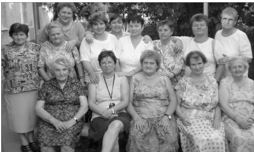
Hétfő délutánonként tartja alkalmait a szölősi nőszövetség