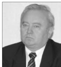
Csúry István püspök

Egyébként az egyházkerületi tisztújítási folyamat, a presbiteri választással már tavaly