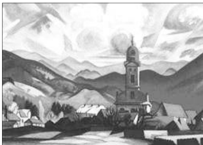
Bornemisza Tibor: Nagybányai táj

A református egyházköztség presbitériuma nem nyugszik bele az iskola felszámolásába és a református felekezeti oktatás visszaállítását szorgalmazza. Több mint egy századnak kellett eltelnie, hogy 1859-ben a presbitérium és a hívek kezdeményezésére egy új, egyemeletes iskola építését kezdjék el. 7000 forintos költséggel indult az építkezés, melynek fedezésére özv. Bogdán Györgyné Kelemen Sára 4200 forint adományt biz-