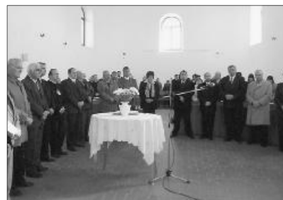
Leteszik az esküt az újonnan megválasztott tisztségviselők