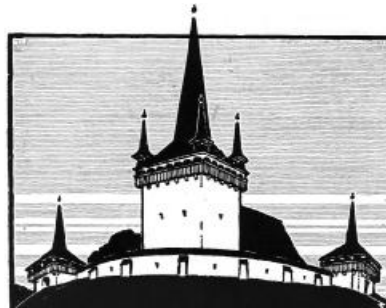
Kós Károly: A valkói templom

Nagyon sok ember álarcot hord: az ostoba okosnak akar látszani, a gyöngye erősnek, a gyáva bátornak. Aki látszat szerint rendezi be egész életét, gesztusai, nyilatkozatai, egész magatartása ehhez igazodik. A