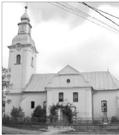
A szilágyballai református templom

A testvérgyülekezeti kapcsolat 1991-ben kezdődött a Református Világtalálkozó sárospataki rendezvényén, ahol először az ózdi, majd később a Kazincbarcika-alsó református gyülekezettel ismerkedtünk meg. Ekkor Kazincbarcikának már volt egy felvidéki testvérgyülekezete: Tornalja. Néhány közös találkozót követően megfogalmazódott bennünk az igény, hogy bővítve a kört, legyen hármas a mi testvérgyülekezeti kötődésünk. 2004-ben egy nagyszabású hármas találkozó volt nálunk, Szilágyballán, amelyen jelen volt Ft. Tökés László, akkori püspök is, aláírásával is ellátva testvérgyülekezeti megállapodásunkat, amelyre Isten áldását kérte.