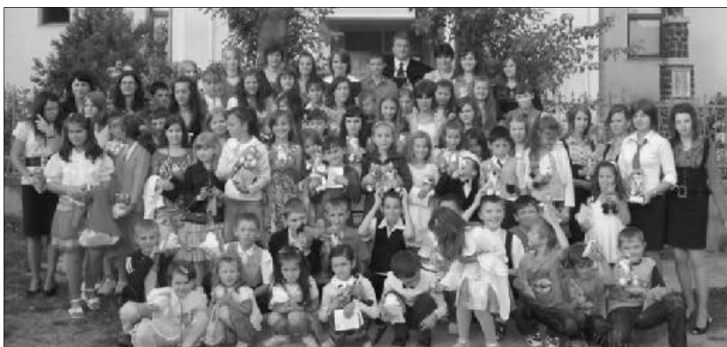
Egy közösségként tapasztalhatták meg, milyen az Isten szerinti igazi ünneplés

A gyermekek megismerkedhettek az Egyiptomból való szabadulás történetével, az ennek emlékére megült Páska ünnepével, amely megvilágította számukra Isten szabadító kegyelmét. A sátoros ünnep kapcsán Isten, mint gondoskodó Atyát ismerhették meg. A kánaeni menyegzőről szóló történet által lehetőségük volt megismerni a zsidó menyegzői szokásokat, valamint a Fiú Isten hatalmát, aki képes ma is csodát tenni életünkben. A pünkösdi történet a Szentlé-