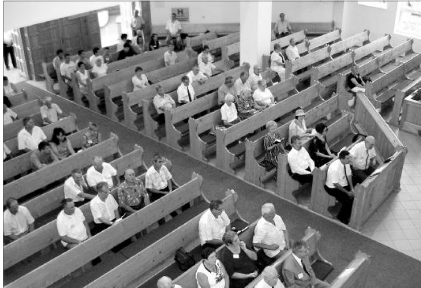
Helyszín és résztvevők. Idén is tartalmas előadásoknak örvendhetett a presbiterek közössége

Augusztus utolsó hétvégéjén, pénteken és szombaton zajlott a Királyhágómelléki és a Tiszántúli Egyházkerület közös szervezésében létrejött presbiteri konferencia, a nagyváradi-rogériuszi református templomban. Az idei konferenciát az Erdélyi fejedelmek, akik a magyar református egyházat szolgálták téma jegyében az egyháztörténelmi előadások határozták meg.