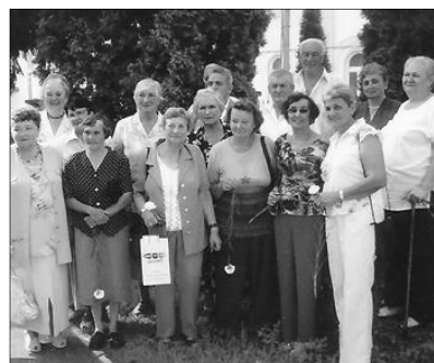
Konfirmációjuk 52. évfordulóján ismét találkoztak az egykori iskolatársak

Az imateremben a helyi nőszövetség kávéval, üdítővel fogadott. Akik előző nap,