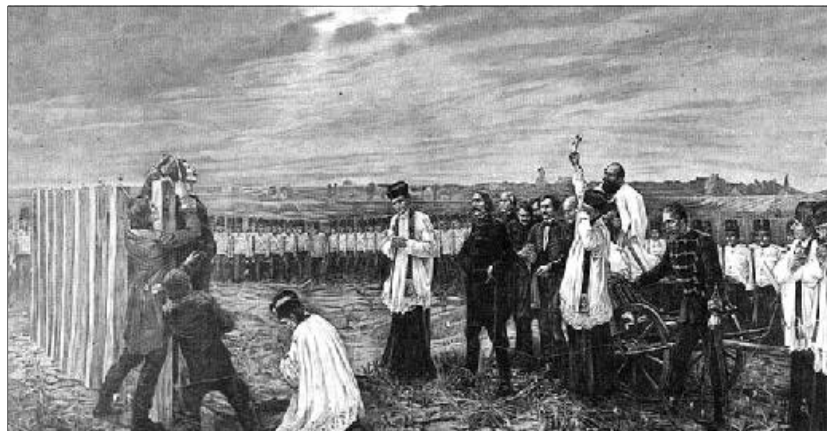
Thorma János: Aradi vértanúk

Poeltenberg Ernő: Minket az ellenség dühös bosszúja juttatott ide.