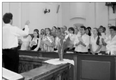
A záróhangversenyen gyülekezeti énekközpontok hangzottak el

Az utolsó három nap már a vizsgák jegyében zajlott. Minden hallgató csoportvizsgát tett, amelyről igazolást kapott, ezzel folytathatja a képzőt a következő esztendőben. Augusztus 20-án zajlottak a hangszeres vizsgák, valamint este hétkor került sor a záróhangversenyre. Az ünnepi istentiszte-