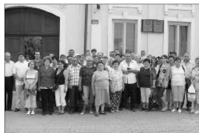
A hegyköziek Szepesiben, a református lelkesi hivatal előtt

A helyi református templomról már egy 1558-ból fennmaradt levél említést tesz. Ekkor a katolikus papon és két hívén kívül az egész város protestáns hiten volt. Az ellenreformáció idején többször cserélt gazdát a templom, majd a Rákóczi szabadságharc leverése után végleg a katolikus egyházé maradt. A templom nélkül maradt reformátusok a temetőben deszkatemplomot építettek, majd folyamatosan kérvényezés után 1772-ben engedélyt kaptak kőtemplom építésére is. Egy év múlva felépült a templom, de az engedély értelmében csak fatoronnyal. Később a türelmi rendelet már