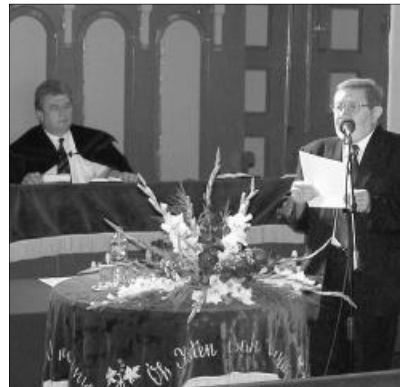
A vasárnap délelőtti istentisztelet egyik momentuma

KEDVES OLVASÓINK! Az idei nyár egyházi eseményeiből szeptemberi lapszámainkban már több tudósítást olvashattak. Az időközben érkezett beszámolóknak is örömmel adunk helyet. Megszokhatták, hogy időnként mellékletekkel „feszoghatták” lapunk 8 oldalának szűk és rég kinőtt kereteit. Ezúttal Református élet című rovatunk jelentkezik négy oldalas melléklettel. Fogadják szeretettel. A szerk.