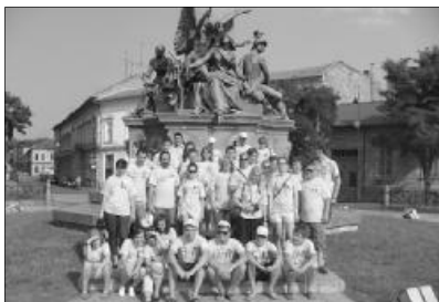
A fiatalok egymás kultúrájával és életszemléletével ismerkedtek

Projektünk másik alapköve a társadalmi szolidaritás és a társadalmi kirekesztettség elleni harc volt. Mivel 2010 a szegénység elleni harc európai éve, ez tükröződött a mi projektünkben is. A csoportok 30 százaléka hátrányos helyzetű fiatalokból állt, akik önréből nem tudtak volna nyaralni. A projekt által lehetőségük adódott arra is, hogy megismerkedjenek a holland fiatalokkal, egy másik kultúrával és életszemlélettel. Az együtt töltött idő, a közös tevékenységek ismét erősítették az összetartozás érzését. A