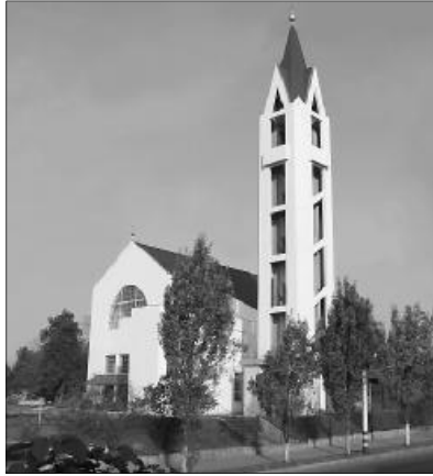
A Várad-rogériuszi református templom