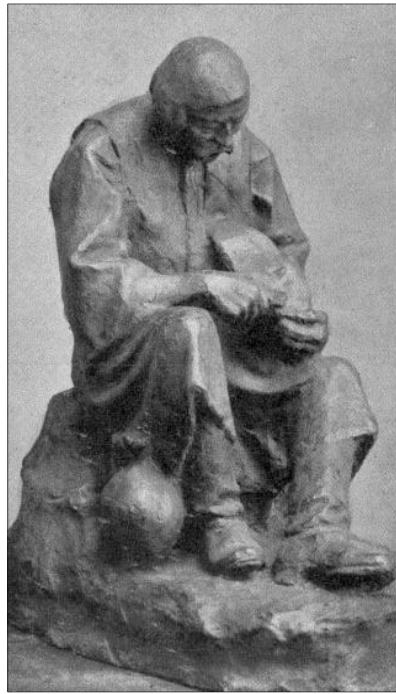
Liipola György: Kenyér