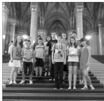
Felejthetetlen élmények az Országházban

A keddi nap ennyi programot engedett magába sűríteni; szerdára hagyva a Debrecenbe tett látogatást. Mielőtt azonban elhagytuk volna Budapestet, elmentünk az Ability Parkba, ahol fogyatékkal élők vezettek át minket különböző programokon, melyek során átérezhettük ezeknek az embereknek a nehéz sorsát, és a velük való be-