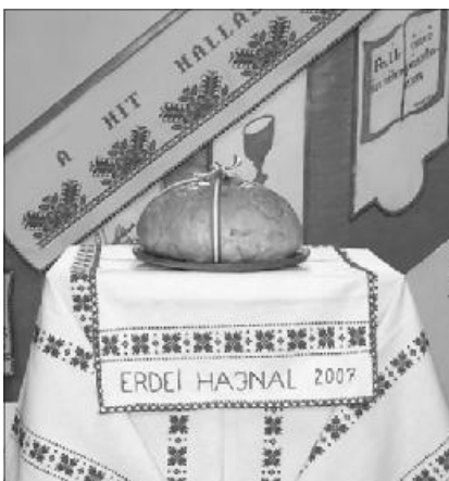
A szilágyolompéti református templom úrasztala újkenyér ünnepén

A kenyérgond a Krisztussal való közösségekben oldódik meg úgy a közösségek, mint az egyének számára. Jézus határozottan kijel-