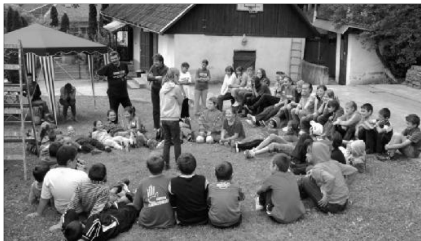
Szamosardón sokéves hagyománynak örvend a bibliahét