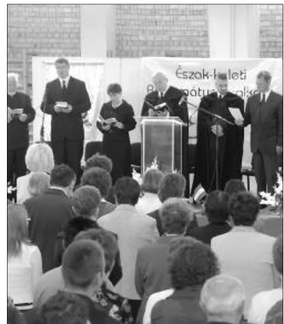
Nem hagyható ki Isten az életünkben. A záróistentiszteleten Csűrű István püspök hirdetett igét

AJTÓNYITÁS A TEMPLOMON KÍVÜL ÁLLÓKNAK. Áhítatok, evangelizációk, koncertek, pódiumbeszélgetések, kórustalálkozó, táncház, bábszínház, bibliodráma és megannyi színes program várta az ÉRT mintegy kétezer résztvevőjét. A szervező Zempléni Egyházmegye célként azt tűzte ki, hogy „a Kárpát-medence északkeleti régiójának reformátusai megmutassák magukat egymásnak és a világnak. A találkozó ugyanakkor ajtónyitás is a templomon kívül állóknak.”