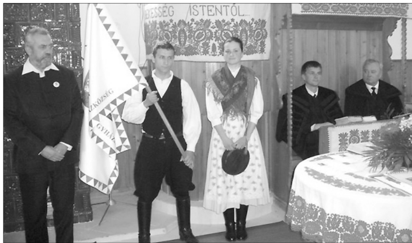
Gondos kutatómunka, előkészítés és kapcsolattartás előzte meg az ünnepélyes zászlóavatást

Május 15-én történelmet írt a szilágyballai gyülekezet közössége. Méltó ünnepség keretében került felavatásra a gyülekezet címeres zászlaja.