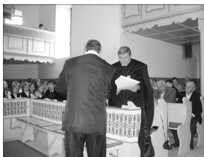
A vendégek, presbiterek, támogatók emléklapokat kaptak