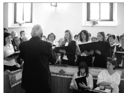
A jubiláló vegyeskar. Számos alkalommal énekeltek itthon és külföldön egyaránt