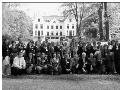
Kárpát-medencéből érkezett egyházi, gyülekezeti munkások, vallásánárok és lelkipásztorok a KOEN évfordulós ünnepén