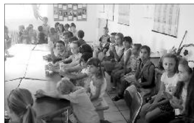
A gyerekeket Krisztushoz vezetni – ez volt idén is a cél