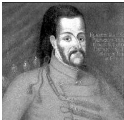
I. Rákóczi Ferenc

1566 és 1582 között öt román református püspöke volt az erdélyi román református egyháznak. A reformáció szellemében ez az egyház román szertartási nyelvű egyház volt és lelkészei románul prédikáltak az Isten igéjét. Első románra fordított egyházi irataik még a XVI. században jelentek nyomtatásban. Ezek a világon az első románul nyomtatott könyvek. A magyar református egyházhhoz hasonlóan ebben az egyházban is megindult az anyanyelvi iskolázás, hogy a hívek tudják olvasni az egyházi irodalmat. Tehát félreértések elkerülése végett, ennek a református egyháznak nem volt célja a magyarosítás, sőt a román anyanyelvi iskolázást és könyvkiadást is ez hozta létre Erdélyben. Egyházilag pedig a román ortodox egyház akkori ósláv liturgiai nyelve helyett, amiből a román nép egy szót sem értett, románul folyt az istentisztelet.