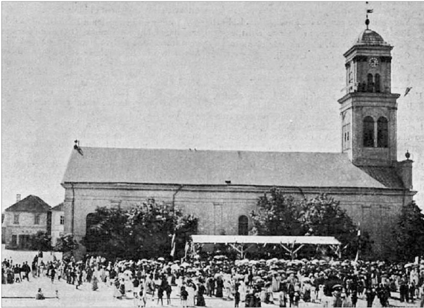
Nagyszalonta, az Erdőhát központja, egy a múlt század elején készült felvételen

A IX. század derekán a hét magyar törzs egyike, a Nyék törzs birtokába vette a Kőrösök vidékének e részét. E mocsaras, nádas, erdővel borított rész az erdőelvi gyulák hatalma alá tartozott. A Gyula, Gyulavarsánd és Gyulató helységnevek a híres erdőelvi vezérek, a gyulák egykori szállásbirtokainak emlékét őrzik.