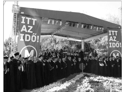
Több tízezen hallatták hangjukat a Mikó kollégium mellett