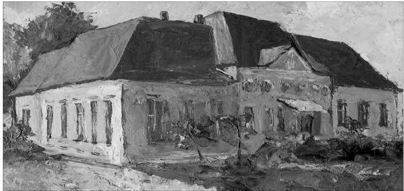
Kovács Lajos Emil: Degenfeld kastély, Hadad