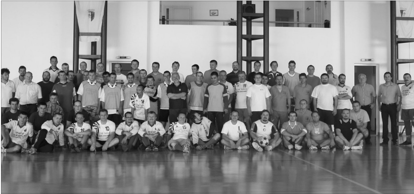
A részvétel és a közösségformálás volt a lényeg

A Kárpát-medencei lelkesítő focikupa legutóbbi kiírásának győztese, a Bihari Egyházmegye rendezte az idei tornát. A szeptember 12-én Nagyszalontán szervezett seregszemplén kilenc csapat képviseltette magát, három Erdélyből, öt a Partiumból és egy Magyarországról.