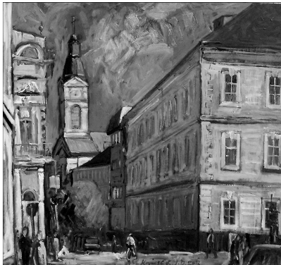
Kovács Lajos Emil: Kálvin téri sarok, Szatmárnémeti

Ha minden ember lehet keresztyén és kell, hogy keresztyén legyen, mi különbség van a presbyter és a többi keresztyén között? Az, hogy az egyház, azaz a gyülekezet elhívta őt és a maga élére állította, ama bizonyos csalhatatlan jegyek alapján, amelyet Isten mutatott meg rajta és azt mondta, miután elhívott téged az Úr arra, hogy közzöttünk élj és ennek jegyeit nyilván látjuk tebenned, kérünk téged és megbízunk téged azzal, hogy ezt a munkát a gyülekezeti életben elvégezd. Először Isten hívta el titokzatos Lelkének végzése szerint. A presbyterségnek nagy táolatai nyílnak meg előttünk: az elhívott és formált, alkotott, célra teremtett léleknek a mélységei tárulnak fel előttünk azután ebben az elhívásban bízva, ezt felismerve, szólott a gyülekezet. Az interna vocatio (a belső elhívás, az Istentől való) az előbbi, az externa vocatio (a külső elhívás, vagyis az emberektől való) az utóbbi; az interna és externa vocationak a boldog találkozása az a presbyteri tiszt, amit mi a gyülekezetben viselünk és hordozunk. Jaj annak, akinél csak külső elhívás van, Isten nem hívta el, csak a gyülekezet hívta el. Jaj annak a gyülekezetnek,