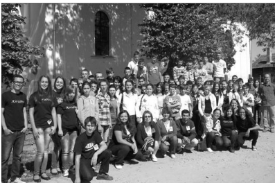
Erdőhāti fiatalok találkoztak

FÖLDESZ MÁRTA erdőgyaraki parókus lelkész