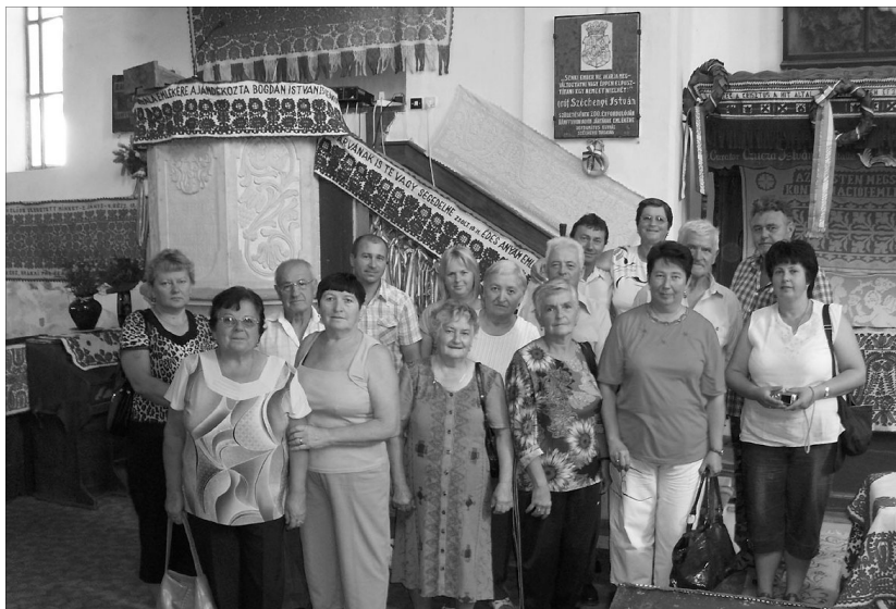
Kalotaszegi templomokban gyönyörködtek az érszakácsi látogatók

Magyarvalkó után a havasok felé vettük az útirányt. A kanyargós hegyi úton több mint ezer méteres magasságba jutottunk fel Belis-re (Jósikafalva). A festői tájon lévő román falut elhagyva a Belis-i tó partjára érkezünk. A látvány magáért beszél. A 120 méter magas gát mögött 23 km hosszúságban kanyarog, a fenyőerdővel borított hegycsúcsok lábainál, a kristálytisza vizű tó. A látvány azonban szomorú múltat takar. A