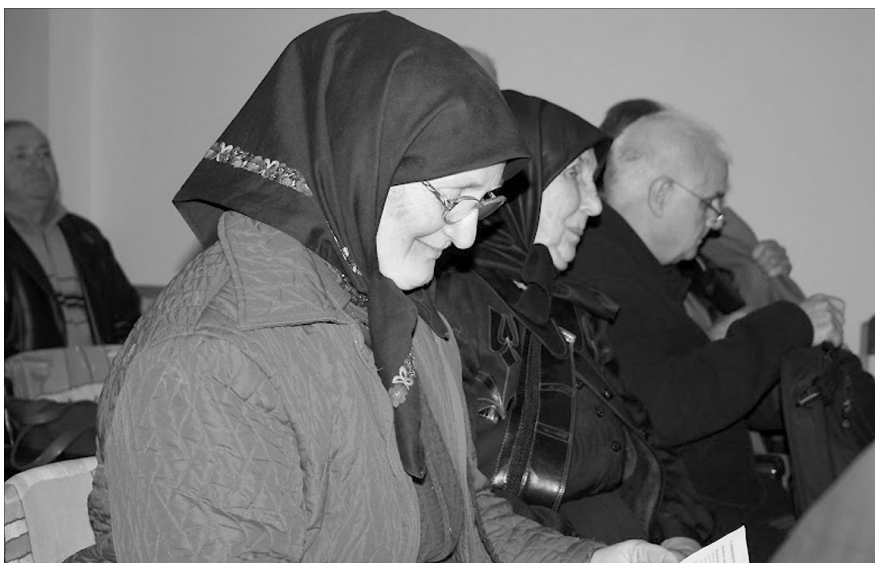
Isten hajlékában. Istentisztelet a húszéves Erdélyi Gyülekezetben

Kedves Testvéreim! Mindig örül a szívem, amikor a református nőszövetségek szolgálatának híre hallom, nem is beszélve arról, amikor meghívottként részese is lehetek összejöveteleiknek. Boldogan látom a kicsi gyülekezetek lelket bátorító asszonyait, szeretettel vagyok az ezres lélekszámú egyházkerületi nőszövetségi találkozókra, vagy ritka élményben részesültem a közelmúltban a kétezer nőtestvért összegyűjtő kerületközi Debrecenben megtartott konferencián.