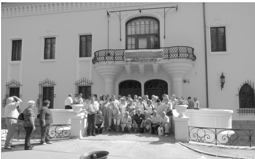
Presbiterek a nagykárolyi kastély előtt. A háromnapos konferenciát kirándulások színesítették

Az idei, sorban a nyolcadik egyházkerületi presbiteri konferenciát a nagykárolyi egyházmegyéhez tartozó Hadadon tartottuk meg, Isten segítségével, augusztus 31. és szeptember 2. között. A 120 résztvevő presbiter a Királyhágómellékről nyolc egyházmegyét, valamint a kárpátaljai, erdélyi és magyarországi presbiteri szövetségeket képviselte.