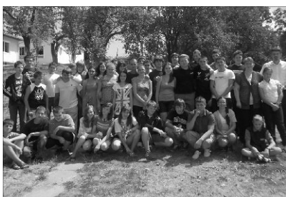
Jövőre is várják az ifjakat a Nagybányai Egyházmegye ifjúsági táborába