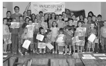
Mindenki megtalálta a helyét a magyarberkeszi bibliahéten

A szombati nap az ifjaké volt. Kirándulást szerveztünk erdélyi történelmünk egyik fontos