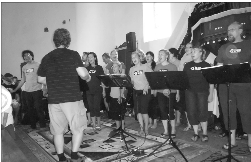
Sajátos módon és eszközökkel hirdetik Isten igéjét. A lelkekig hatolt a finn gospel kórus fellépése

Július 25. és augusztus 12. között több nemzet képviselői is egyházi szolgálatot végeztek a Pelbárthidai Református Egyházközösségben, ami igencsak megmozgatta a gyülekezet tagjait és a falucska lakosságát.