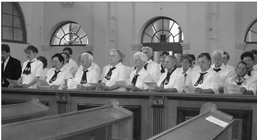
Az avasújrósi nőszövetségi énekkar

„Az ének szebbé teszi az életet, az éneklők másokét is. Nem sokat ér, ha magunkban dalolunk, szebb, ha ketten összedalolnak. Aztán mind többen, százan, ezren, míg megszólal a nagy Harmónia, amiben mind egyek lehetünk. Akkor mondhatjuk majd csak igazán: Örvendjen az egész világ.” (Kodály Zoltán)