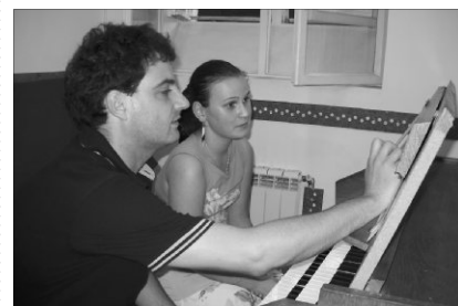
Idén hetedjére rendezték meg a kántorképzőt

Volt utcai éneklés a nagyváradi főutcán, fórum és beszélgetés Csúry István püspökkel, ahol aktuális gondokról és terkekről esett szó. A közbeeső két vasárnapon a képzősök egy csoportja az újvárosi református templomban szolgált kórusénekekkel.