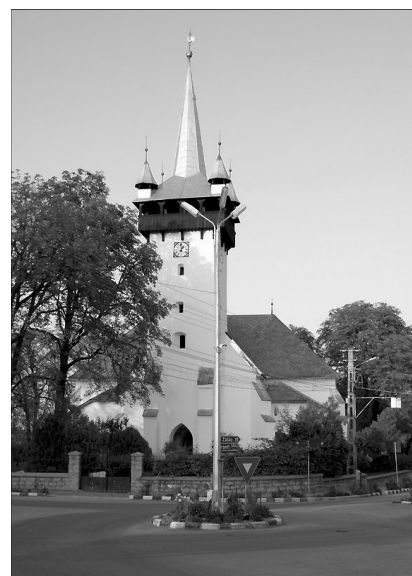
A krasznai templom korábban a provinciális gótikát példázta