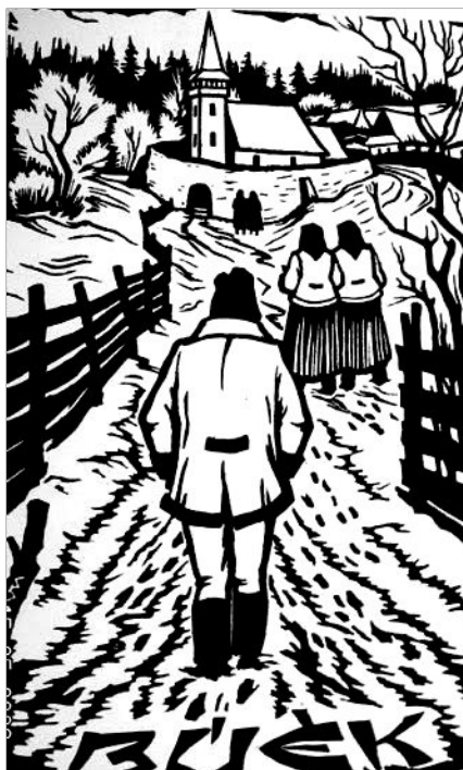
Gy. Szabó Béla alkotása

Enekek Éneke 1,5-8 Szeretni és szeretetnek lenni Zsolt 139,1-6 Megvizsgálj és ismerj engem 3Jn 2,8 Vendégszeretet Krisztusban Jn 15,12-17 Barátaimnak nevezlek benneteket