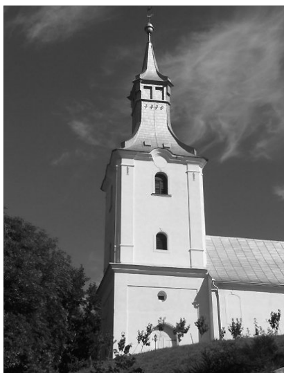
Ipp temploma két XVII. századi, a Bideskúti család tagjainak emléket állító sírkövet is őrzi

Kisebb méretű késő gótikus református templom áll Szamosardó fölött egy dombtetőn. Hajóját és a nyolcszög felével záródó, két boltszakasznyi hosszúságú szentélyét kéttagú támpillérek erősítik, a hajónál aszimmetrikus elrendezésben. A szentély északi oldalához az egykori sekrestye helyére 1958-ban harangtornyot építettek. A deszkamennyezetes templom ablakaiból hiányoznak a mérművek. Nyugati kapuja félköríves, a sekrestyekapu pedig szemöldökgyámos, mindkettő csavart kanellúrájú lábazatról induló, hengertagos bélletű. Diadalívét utólag alakíthatták félkörívesé, konzoljai fölött az egykori diadalívkereszt fészkei láthatók. Az egyik déli saroktámpillér vízvető fölötti kváderén fekvő helyzetű Drágffy-címer található, valószínűleg