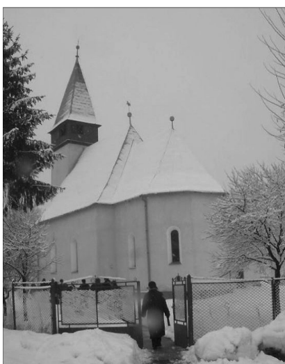
Hosszúmező templomának középkori eredetéről inkább csak arányai tanúskodnak

Misztótfalunak a Szatmár-nagybányai műút sávjai által közrefogott, kőkerítéssel is körülvett református temploma viszonylag híven őrzi XV. századi állapotát: gazdagon profilozott csúcsíves nyugati kapuja, ülőfülkéje, szemöldökgyámos sekrestyekapuja és tabernákulumfülkéjének sajátos kialakítású kerete gótikus faragványok, ablakainak mérműit azonban kiszedték, szentélyének boltozatát lebontották. Héjazata és alacsony hajlásszögű, alulméretezett fedélszéke is cserére szorul, ezért a közeljövőben felújítását tervezik. Torna 1893-ban épült hozzá.