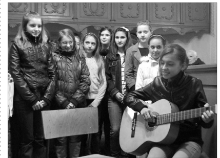
A gyermekek is köszöntötték az időseket

Az istentisztelet alapigéjével szolgáló 71. Zsoltár 14-21. versei elsősorban az idősök áldásaira hívták fel a gyülekezet figyelmét, hangsúlyozva azt, hogy az öregkor – a maga gyengeségeivel és bajaival együtt – az