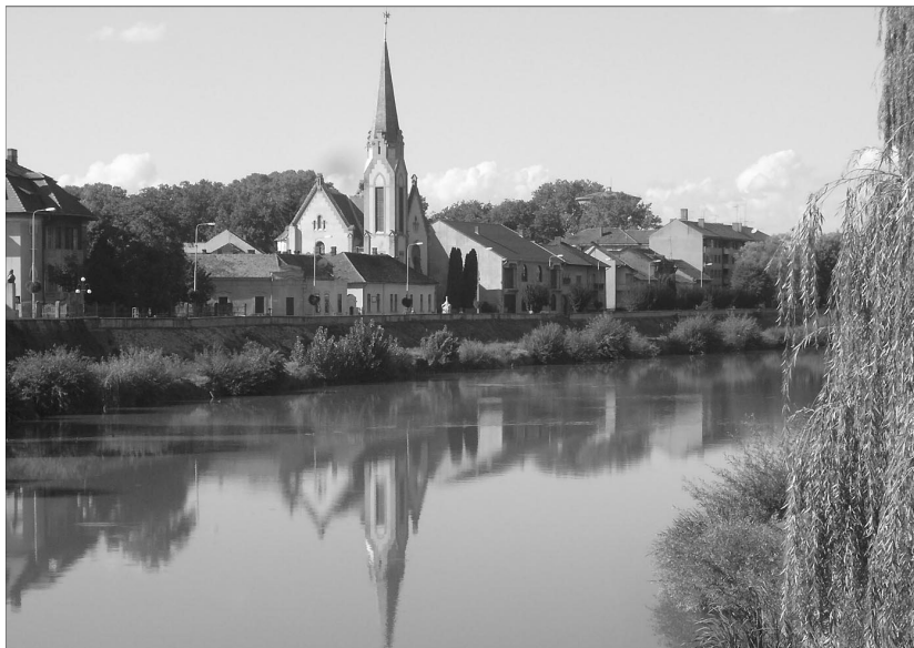
Az impozáns lugosi templomba várják a presbiteri konferencia résztvevőit

A Királyhágómelléki Egyházkerület Presbiteri Szövetsége