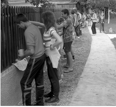
A szorgos ifjak szeretethidat építettek Vadászon

✿ SZERETETHÍD VADÁSZON. A Vadász Református Egyházközség az idei Szeretethíd első napját a fiatalok önkéntes munkája segítségével szervezte meg. A Sportpálya kerítése és a kapu befestése a mintegy tizenöt fiatal munkáját hirdeti. Reméljük, a