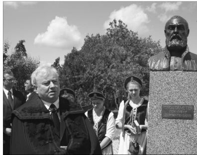
Tordai Demeter emlékéét élteti a mellszobor

Május 18-án, szombaton délelőtt 10 órától gyülekezett az óvári református temp-