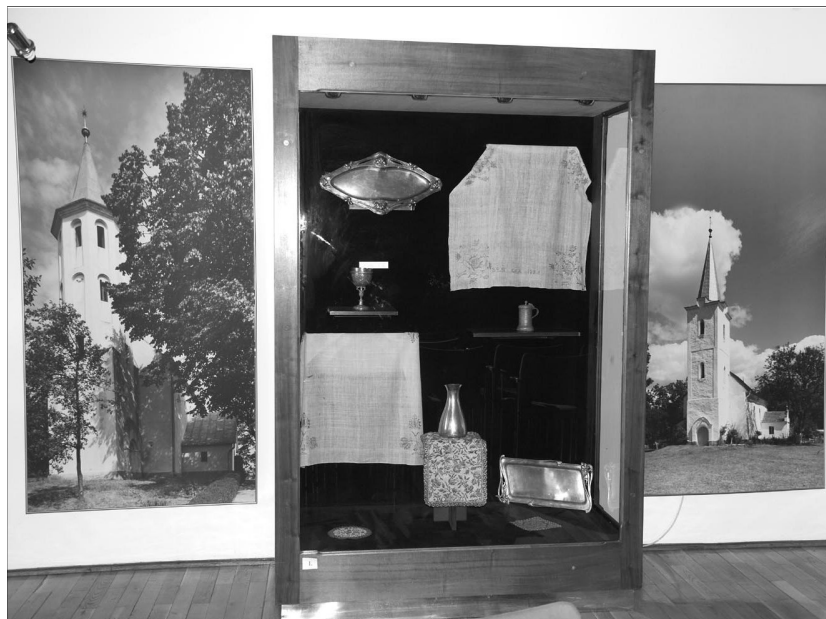
Mecénások öröksége. Országos szinten is egyedülálló a Partiumi Református Múzeum

A Királyhágómelléki Egyházkerület és a Nagyvárad-Olaszi Egyházközség közösen hozták létre az országos szinten is egyedülálló Partiumi Református Múzeumot, melynek gondolata a várad-olaszi lelkésztől származik, s mely a Lorántffy Zsuzsanna Egyházi Központ épületében kapott helyet.