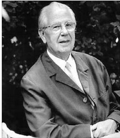
Gyökössi-centenárium. Szolgálatának legfőbb ismérve, lehajolni az elveszett emberhez

...Uram, irgalmas voltál ehhez az emberhez, hogy hazahívtad, hogy felszaba-