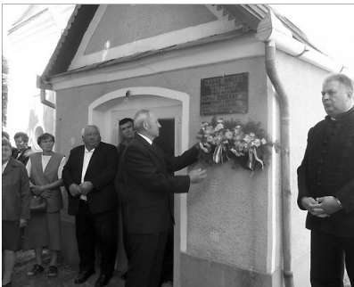
Az elődök tisztelete. Az egykori csatári lelképásztor emléktáblája

✿ HÁRMAS ÜNNEP HEGYKÖZCSATÁRBAN. Május 19-én délelőtt a hegyközsatári református gyülekezetben hármasszünnepeket tartottak, Pünkösöd első napját, a 25, 50, 60 és 70 évvel ezelőtt konfirmáltak találkozáját, valamint emléktábla avatásra is sor került a gyülekezet egykori lelképásztorra és felesége tiszteletére.