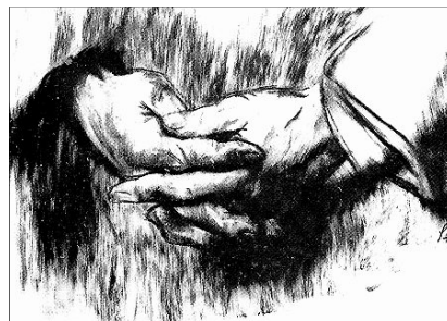
Szőnyi István: Összekulcsolt kezek

Az anya ott ült egész éjjel Boriska mellett, a lábait melengette kezeivel és szerető könnyeivel. A görcs nem ment tovább, meg-