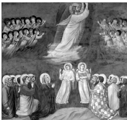
Giotto: Jézus mennybemenetele

Az, hogy Jézus Krisztus mindenek fölött van, mindenki „lábai” alá vetetett e földi és