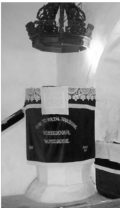
A menyői szószék

Az épületet 2002-ben állították helyre, de sajnos alapos kutatás előtte nem történt.