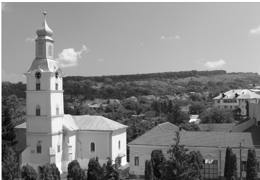
A szilágycsehi református templom. Jobbra a parókia épülete

A kirvai dombok közé bújva a Szilágycsehi Református Templom Dészházával átellenes mellékvölgyében fekvő Menyő falu kicsiny templomának hajóját délről két csúcsíves, provinciális mérműdíszes ablak világítja meg. Szentélye a nyolcszög öt oldalával záródó, sarkait – a délkeleti kivételével – támpillérek erősítik. Déli falát csúcsíves, zárófalát körablak töri át, famennyezete a hajóhoz hasonlóan kazettás. Diadalíve csúcsíves. A hajó és a szentély közti építési fáziskülönbséget jelez a fő-tengelyeik közti 1,3 m-es eltérés. Falkutatás nélkül azonban nem lehet pontosítani, hogy ez milyen építéstörténeti körülmény eredménye.