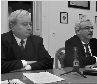
Közös egyházi fellépés