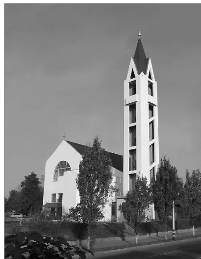
A rogériuszi imahét hitet erősítő, szívet bátorító alkalmakat tartalmazott

Az ez évben Istenből gyülekezeteinknek ajándékozott imaalkalmak – hisszük – nem befejeződtek, hanem arra adtak mennyei