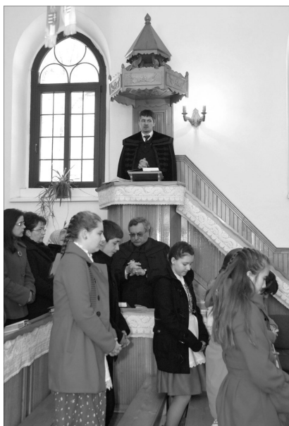
Apahegyi vendégeivel közösen ünnepelt a koltói gyülekezet

Ezeket a gondolatokat és érzéseket élhette meg Koltón az apahegyi, alig 150 lelkes gyülekezet 27 fős kis csoportja, idősök és fiatalok. Boga Árpád szolgatárs ígéhirdetése után, fiataljai alkalomhoz illő műsort mutattak be. A szoborparkban történt koszorúzást követően a koltói fiatalok szolgál-