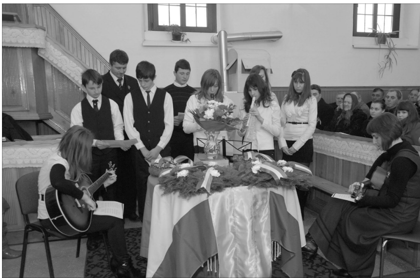
Az apahegyi fiatalok ünnepi műsora