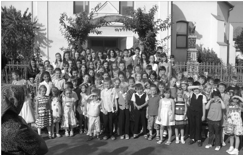
A bibliai történetek útjelző tábláit követték a szilágyballai bibliahét résztvevői

Sok-sok kis utas érkezett a szilágyballai református parókia udvarára augusztus 19-25. között. Dél előtt a kicsiny óvodások és az I-IV. osztályosok csoportja, délután pedig az V-VII. osztályosok vettek részt azon az utazáson, amelyen nemcsak térben, de időben is együtt mentünk Kíváncsi Pétrával.