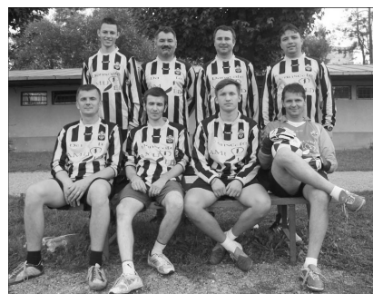
Jöttek, láttak, mentek – a zilahiak jókedvét a kiesés sem törte le