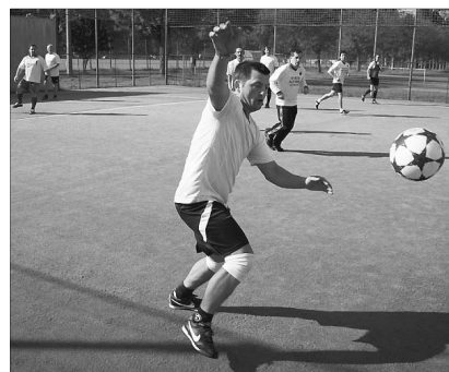
A bihariak gólerős kántora