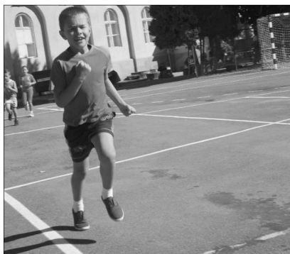
Az egyik kis versenyző

✿ ÉP A TEST, HA ÉP A LÉLEK – KÉT-SZÁZ FIATAL A SPORTNAPON. Sport-szerűségről, jókedvről, izgalmakról és frenetikus hangulatról szólt a Szatmárnémeti Református Gimnáziumban megrendezett egyházkerületi sportnap, ahol négy egyházmegye (Bihar, Szilágysomlyó, Érmellék és Szatmár) húsz gyülekezte képviseltette