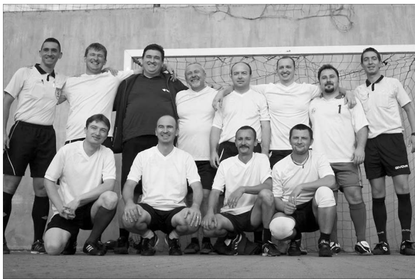
Két éven belül második alkalommal ért fel a csúcsra a Bihar Egyházmegye foci csapata.