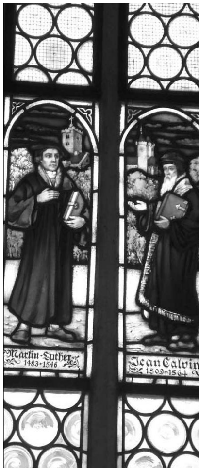
„A reformáció meghatározó hitünk és erkölcsi életünk megélése szempontjából”

Lásd, téged sem kerül ki Jézus, neked is kínálja az élő vizet, amit te csak szintén, lelki rútságodat el nem takarva fogadhatod el!