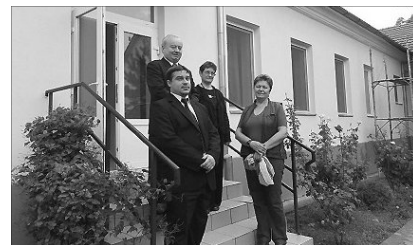
Pályázati pénzből újult meg a bentlakás

A püspök hozzátette, a Lorántffy gimnáziumban szeretnék megalapozni az egyetemre készülő ifjak keresztyén hivatástudatát. Ennek során a humán osztályok tanulóit az értelmiségi szakmák felé szeretnék irányítani, míg a reál osztályok esetében nagyobb szerepet kap a számítógép-központú oktatás.