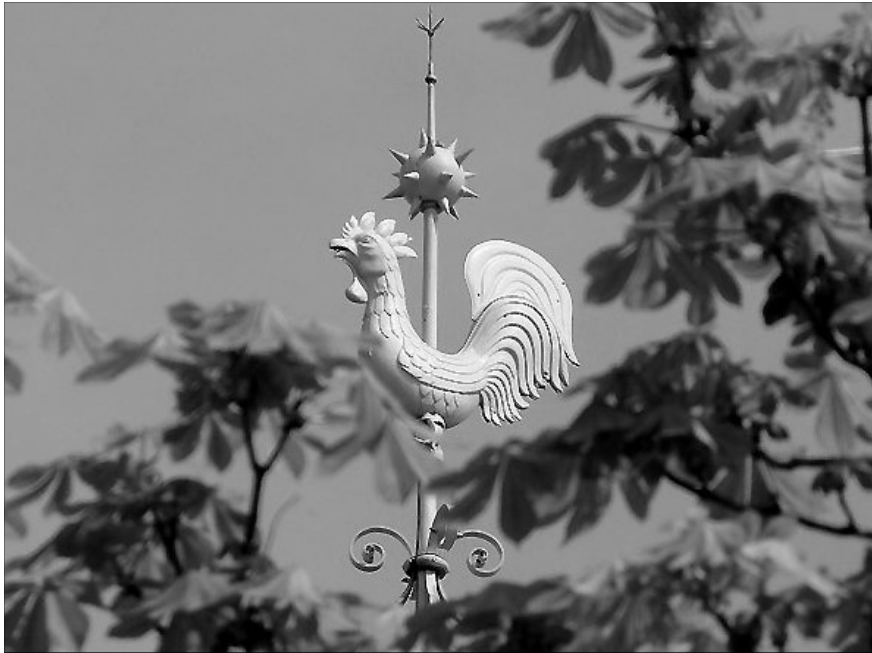
„Reformációra nem az istentelenség van szüksége, hanem a hívőnek.”