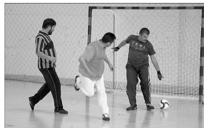
Nem volt könnyű túljárni Pásztori tanár úr eszén