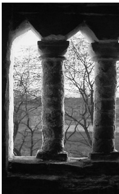
Tájkép a toronyból