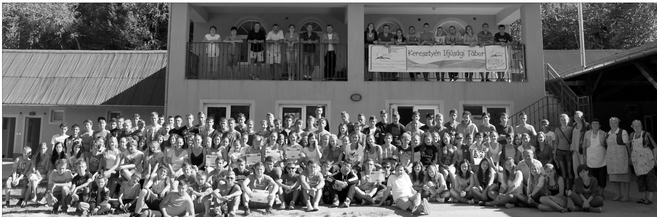
Idén egyházkerületi táborra nőtte ki magát a sólyomkővári ifjúsági találkozó

A Szilágysomlyói Egyházmegye minden nyáron megtartott ifjúsági tábora az egyik legnagyobb múlttal bíró rendezvény egyházmegyénk életében. Már nem is tartjuk számon, hogy sorrendben hányadik tábor következik, hanem inkább hálaadással adjuk tovább a hírt: amint az elmúlt években, úgy az idén is megrendezésre került a hagyományosnak számító KRISZ-tábor Solyomkőváron. Külön többlet volt e rendezvénynek, hogy az idén egyházkerületi táborra nőtte ki magát, és így nemcsak a Szilágysomlyói Egyházmegye, hanem más egyházmegyék (Bihari, Érmelléki) területeiről is érkeztek résztvevők.