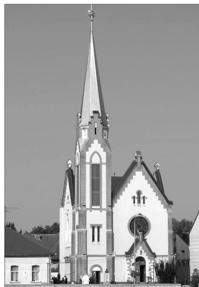
A lugosi református templom

Beszámolómban nem tudom visszaadni azt a jó hangulatot, ami a konferenciát jellemezte, mivel csak száraz tények felsorolására szorítkozok, de higgyék el nekem, nem hiába hangzott el egyesektől a címben leírt jelző. Sok minden biztos kimaradt rövid beszámolómból, ami más testvérünknek fontos lehet, de nem szándékosan, mivel három nap ajándékait nehéz pár sorban leírni.