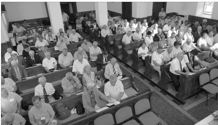
Kilenc év alatt minden egyházmegyébe eljutott a presbiteri szövetség konferenciája.