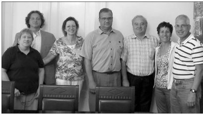
Az egyházkerület képviselői az amerikai testvéregyház küldöttségét fogadták

Egyházkerületünk elnöksége augusztus 28-án fogadta amerikai testvéregyházunk képviselőit. Csúry István püspök amerikai testvéregyházunk krisztusi szolidaritását köszönte meg, majd általános helyzetjelentést nyújtott a királyhágómelléki kihívásokról és erőfeszítésekről. Varga Attila főgondnok egyházkerületünk és az állam viszony-