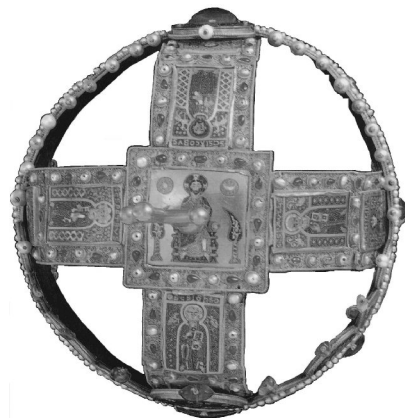
Király nemlétében a Korona jelképezi a törvényes közhatalom folytonosságát

A magyar alkotmány 1541 után kényszerűségből kiegészült Erdély államiségának kialakulásával. 1570-ben kötötte meg a speyeri szerződést II. János választott magyar király és I. Miksa megkoronázott magyar király, melynek értelmében II. János lemondott a királyi címről, I. Miksa pedig elismerte őt Erdély fejedelmének úgy, hogy