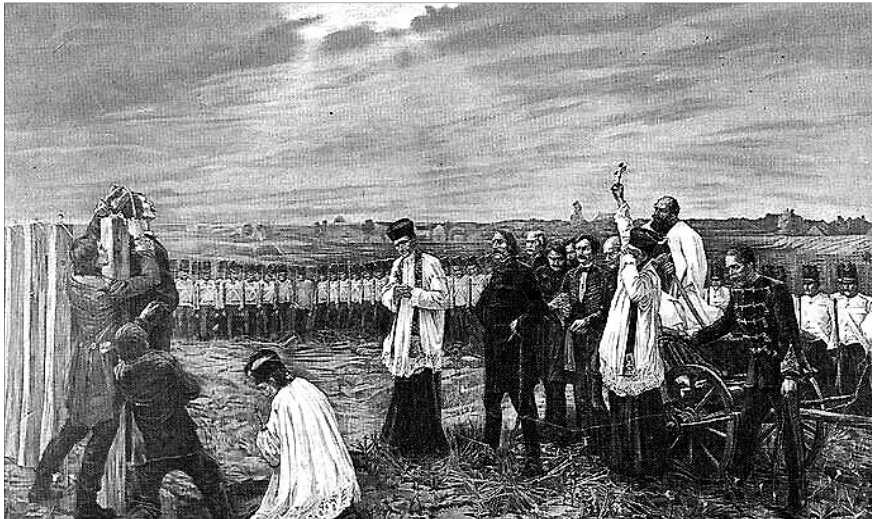
Thoma János: Aradi vértanúk (1893-96). „A kép előterében az első áldozat: Pöltenberg generális nyakára veti a hurkot a hóhér, a Damjanik körül csoportosuló többi tábornok komoran, méltóságteljesen várja sorsbeteljesülését.” (M. Heil Olga)

1849. október 6. gyászterhes eseményére emlékezünk minden évben. Volt, amikor nem lehetett nyilvánosan emlékünnepet ülni, akkor a szívünkben gyászoltunk és éreztük át, hogy a szívünkben Istene végül is a nemzet győzelmére fordította a hősök áldozatát. A magyar- és világszabadság bajnokai szenvedtek pedig 1849. október 6-án mártírhalált. A második bécsi forradalom (1848. október 6.) első évfordulóját, Latour gróf császári-királyi hadügyminiszter meglincselésének napját választotta a győztes hatalom a megtorlás véres színjátéka nyitányául.