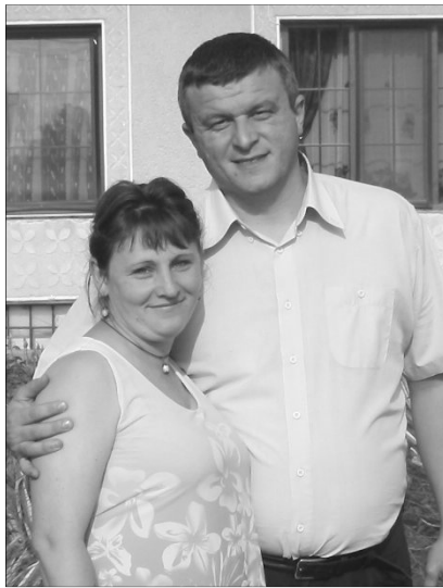
A Kátai házaspár reményekkel vágott neki életük új fejezetének

– Börvely nagy közösség, több mint 1200 lelkes református gyülekezet van itt. Úgy ismertem meg az itteni embereket,