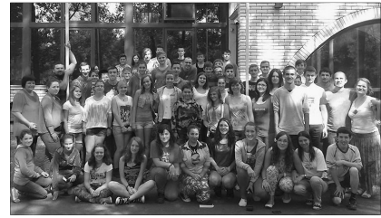
Vekeri-tó: A Bihari KRISZ idei táborának résztvevői