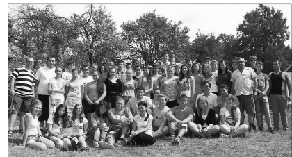
Szamosardó: Egyházmegyei ifjúsági tábor

✿ A rovatba szánt eseményképeket, legtöbb egy mondatos kísérszöveggel a harangszo@yahoo.com e-mail címre várjuk.