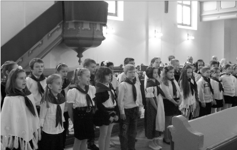
Az érmihályfalvai Bernáth József Református Iskola növendékei

„...és nagy szegénységükből a tisztaszívűség gazdasága lett.” (2Kor 8,2b) Ezt a dicséretet Pál apostol a filippi és a thesszalonikai, a Macedóniában élő keresztyénekről írta. Pál őket azért nevezte tisztaszívűségben gazdagoknak, mert abból a kevésből, amijük volt, őszintén, szeretetből, önzetlennül, Isten iránti hálából adtak a jeruzsálemi éhező és szükségben levő keresztyéneknek. Ők a kevésből is adtak, abból adtak, amijük volt, így köszönték meg Istennek mindazt, amit eddig nekik adott. Az Ő gondviselésébe kapaszkodva nem azt nézték, hogy nekik mennyi marad, hanem azt, hogy Isten nekik és rajtuk keresztül másoknak is mennyi mindent adott és adhat még. Adományait nem azért adták, hogy ezért lekötözzék maguknak a jeruzsálemieket, hogy alkalomadtán a fővárosiak előnyökhöz juttassák őket, hogy később érdekeik szerint képviseljék majd őket, hogy érdemként számon tartsák segélyeiket, jótetteiket. Egyszerűen névtelenül, Isten iránti hálából és szeretetből segítettek a szükségben levőkön, ami tisztaszívűségükről, lelki gazdagságukról beszélt.