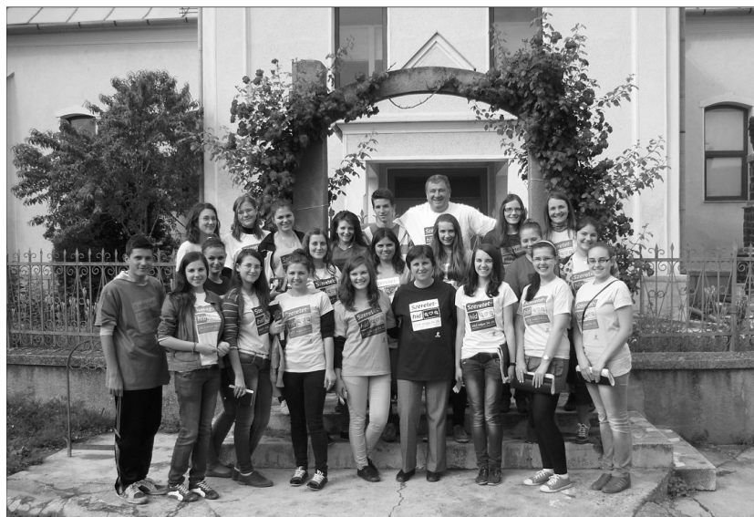
Ifjak szolgálata a krisztusi szeretet jegyében. „Felvállaltuk, hogy mi is az Úr szolgálatában állunk”

„Ne csak szóval szeressünk, hanem cselekedettel és valóságosan.” (1Jn 3,18) – hangzott az idei Kárpát-medencei református önkéntes napok mottója, amely a szilágyballai református ifjúságot immár másodikjára hozta lázas készülődésbe. Az elmúlt év tapasztalatai, élményei alapján úgy gondoltuk, hogy idén még több emberhez igyekszünk eljutni.