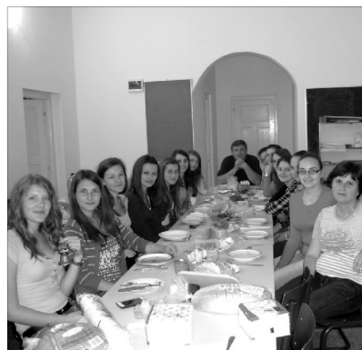
Az olvasóéj résztvevői