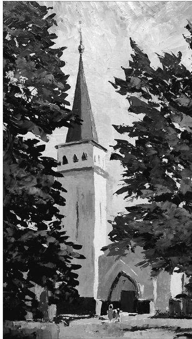
Kovács Lajos Emil: Kültelki református templom, Szatmárnémeti

„Kérlek azért az Isten és Krisztus Jézus színe előtt, aki ítélni fog élőket és holtakat az ő eljövetelekor és az ő országában, hirdesd az igét, állj elő vele alkalmas és alkalmatlan