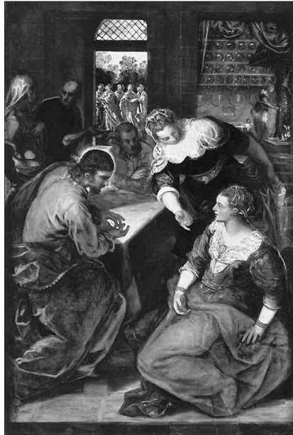
Tintoretto: Krisztus Márta és Mária házában

Micsoda hangnem-váltás! Márta indultoktól fűtött, bosszús kifakadására Krisztus, a vádlott Vendég, szelíd hangon, simogató „moll hangnemben” válaszol, és oldja meg a kínos helyzetet. Egészen különös! Krisztus „nem vág vissza”, nem haragszik, nem is dor-