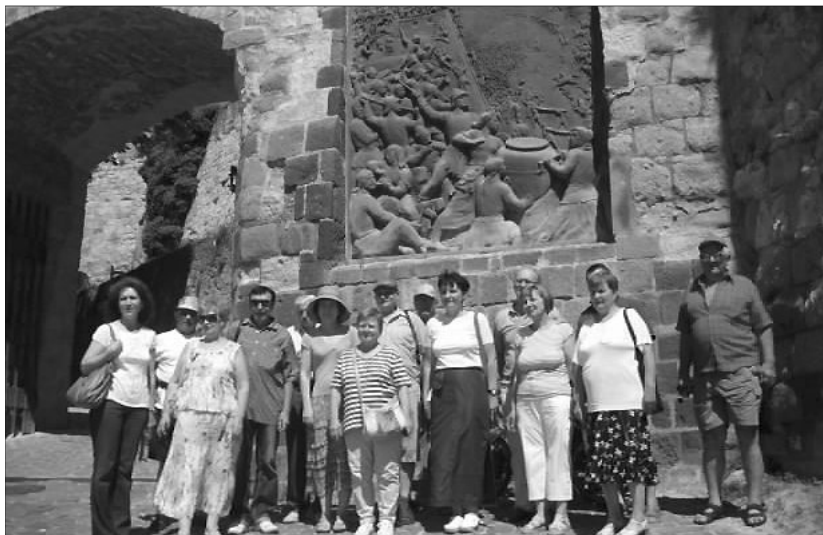
Számos élménnyel gazdagodtak a nagybányai kirándulók

A következő napunkat Egerben töltöttük. A várost a legrégebbi és műemlékekben a leggazdagabb városok között tartják számon. Kis csapatunk meglátogatta az egri várban a Dobó István Vármúzeumot, ahol a falak, a bástyák, a kiállítások anyaga mind a történelmet idézik. Belépve a nagykapu baloldalán Tar István-III. Gyula: Az egri vár védői című, az ostromjelenetet ábrázoló műve látható. Az emeleti termekben a vár történetét bemutató kiállítást néztük meg, ahol Dobó István címerét, egy rekonstruált ágyúállást, harci eszközöket, maketten csatajelenetet, janicsár öltözetek, agyagedényeket, pénzérmekeket láthattunk. Érdekes élményt nyújtott a föld alatti építmények megtekintése, ahol megcsodálhattuk és hallhattuk a tüzes kereket, amit Bornemissza Gergely szerkesztett és Tinódi Lantos Sebestyén leírása alapján rekonstruáltak.