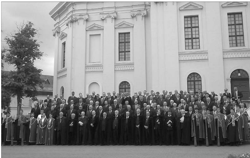
Zsinati összkép a Nagytemplom mellett