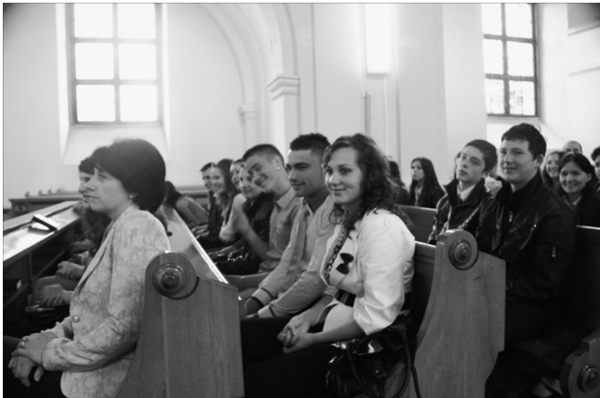
A közösségtől eltávolodott fiatalokat újra közel kell hozni a gyülekezeti élethez

Istennek hála, a Nagybányai Egyházmegyében a nyár folyamán, immár második alkalommal sikerült megszervezni, az egész egyházmegye fiataljait megszólító ifjúsági istentiszteletet. Az első alkalomnak, amely még kísérleti jelleggel, tavaly novemberben volt megrendezve, a vámfalui egyházköz-ség adott otthont.