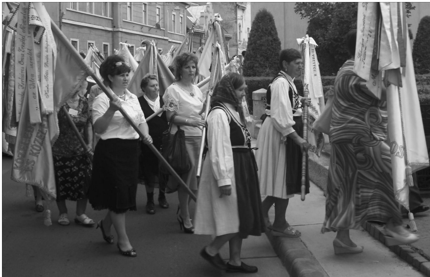
Nőszövetségek közösségi élménye. Zászlós bevonulás a templomba

A fenti üzenet maradt a július 20-án tartott református nőszövetségi nyári találkozó mondanivalója, útravalója sok asszonytestvérem visszajelzése szerint. A több mint 1600 résztvevő úgy jött, mint akinek kevés vigasza van, sok bánata, sebe, terhe, nyomorúsága, ám lelkiekben megelégedve és hitében megerősödve indult haza Szatmárnémetiből.