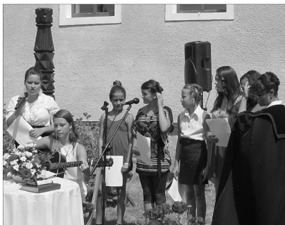
A kakucsi ifjak szolgálata

✿ FELHÍVÁS SZOMBATI-SZABÓ ISTVÁN SZAVALÓVERSENYRE. A Lugosi Református Egyházközség október 5-én (szombaton) kilencedik alkalommal hirdeti és rendezi meg a szavalóversenyt, nem hivatalos versmondók számára, a következő benevezési kategóriákban: 1. elemi iskolák I-IV. osztályos tanulói, 2. általános iskolák V-VI. osztályos tanulói, 3. általános iskolák VII-VIII. osztályos tanulói, 4. középiskolák IX-XI. osztályos tanulói, 5. középiskolák XII. osztályos tanulói – egyetemi hallgatók, 6. felnőtt korosztály.