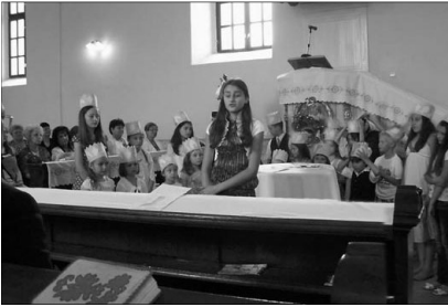
Szinérváraljai gyülekezeti nap