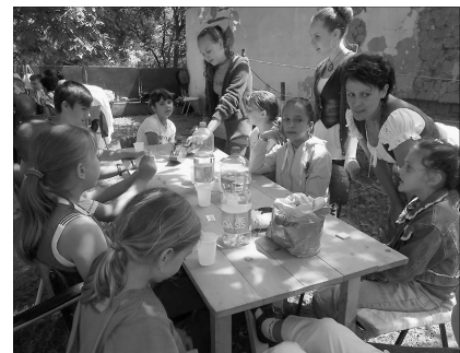
Kiscsoportos tevékenység Diószegen