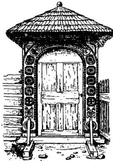
Kós Károly alkotása

Pál apostol bár sok gyülekezetben élt, nem kért sem ételmet, sem ruházatot, nem várta el, hogy eltartsák őt, noha az kijárt volna neki, „méltó a munkás a maga bérére”. Éjjel és nappal szorgalmasan, keményen dolgozott, eltartotta magát, megkereste mindennapi megélhetéséhez a szükséges pénzt. Ő jó példát adott, vallotta és bizonyította is, a