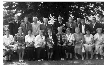
Érmihályfalva: korfirmáltak találkozója