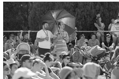
Mezőtúr: Partiumiak a Csillagponton