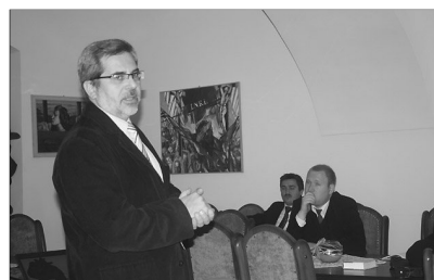
Az Istennel való közösségnek gyógyító hatása van