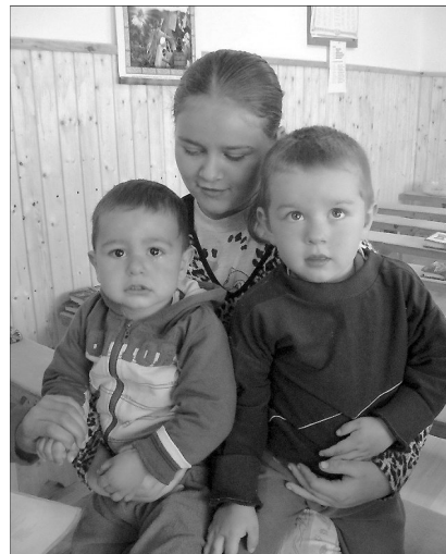
Marosvécsi gyermekek

A kiindulási tévhit tehát, „hogyan jobban érvényesüljön a gyermek!” Ennek érdekében keresi meg a „legjobbat” gyermeke számára. A kényelmi elv is vezet: a legkisebb legyen gyermeke leterhelése. Furcsa dolgokat szok-