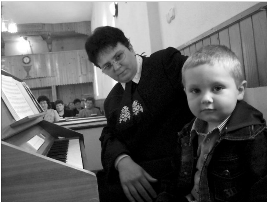
A magyar gyermek akkor érvényesül a legjobban, ha a magyar iskolába jár

Lassan két évtizede Erdély- és Partium-szerte egyre több helyre hívnak előadást tartani, hogy segítsék kisebbségi életünk mellett felsorakoztatni, szinte ledöbbenünk. És sajnos e jelenség már nem csak a szórványtelepüléseket, nagyvárosaink magyar családjait érinti, hanem eljutott a tömbvidékre is. Mint valami tömeghisztéria, lengi be Erdélyt a „jobban érvényesülés” tévhite, a román iskola utáni áhítozás. Én ebben a kis írásban inkább az élet és a példák felől szeretném erre a veszélyre a figyelmet felhívni, mert úgy érzem, egyetlen olvasó számára sem érdektelen ez a kérdés. Mert ha Biharban, Szatmáron, a Szilágyságban vagy a Berettyó völgyében könnyedén arra gondolunk, hogy „ő, ez minket nem érint”, nagyon tévedünk.