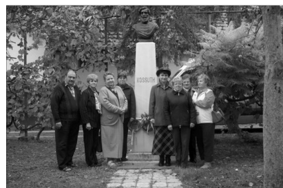
Segítségnyújtók és vendéglátók, a tenkei Kossuth-szobornál