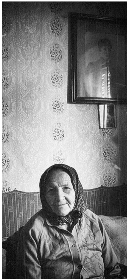
„Az öregség a gyümölcstermés korszaka”

Ez a látás egyre inkább az élet Urára, kegyelmes Istenünkre emeli tekintetünket. Az élet az Ő ajándéka, mi pedig hatalmának és atyai szeretetének megajándékozottjai va-