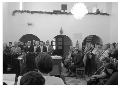
Kétszáz éves a borossebesi református templom